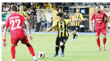
EUROPE, GET READY!