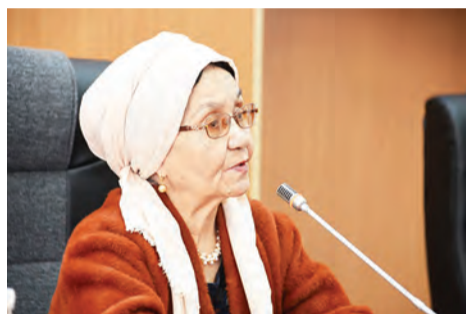
ҰЛТТЫҢ ҮЗІЛМЕЙТІН ЖІБІ