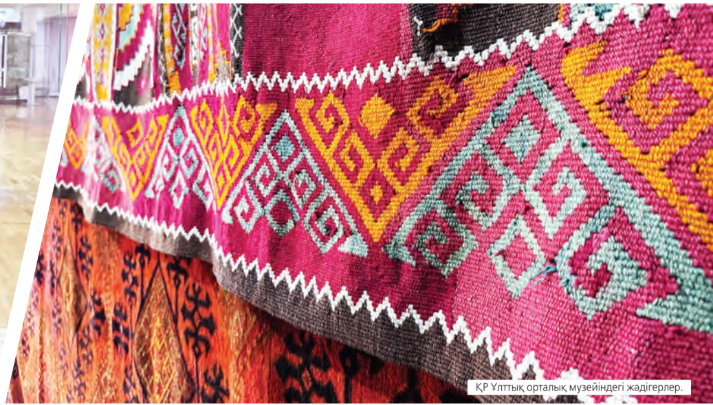
ҚР Ұлттық орталық музейіндегі жәдігерлер.