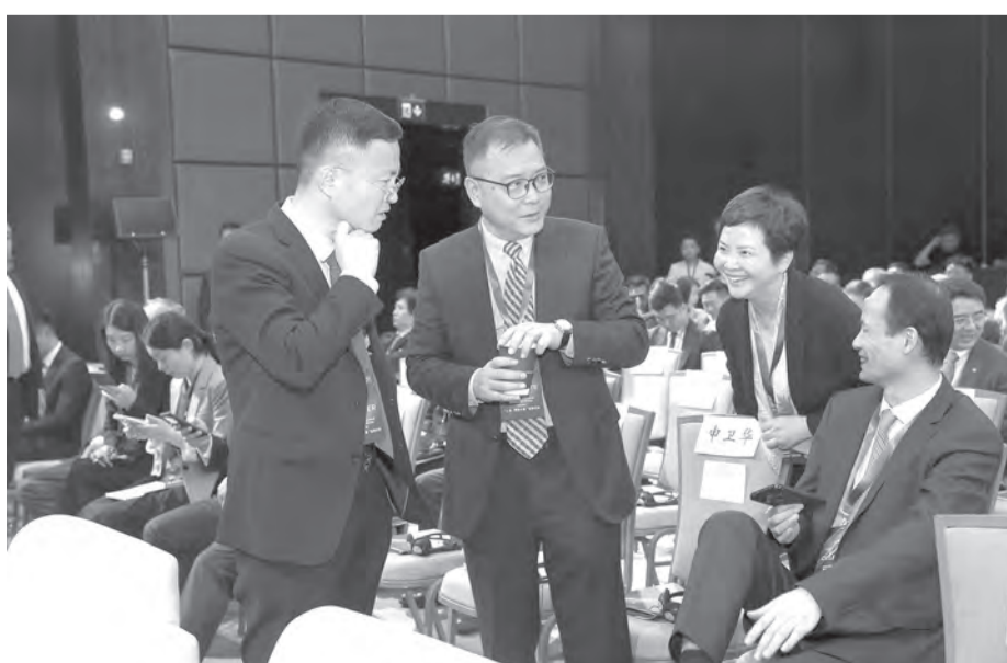
Суреттерді түсірген Қайрат ҚОНЫСБАЕВ.

Сонымен қатар, Нань И. Алматы мен Шанхай арасындағы іскерлік және көлік байланыстарының нығайып келе жатқанын айтты. Әуе қатынасы кеңейіп, бизнес қауымдастықтар арасындағы өзара әрекет күшейген. Қазақстан жолдарында қытайлық электр көліктері көбейіп келеді.